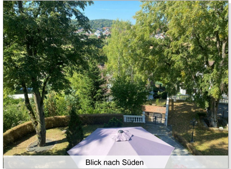
Blick nach Süden