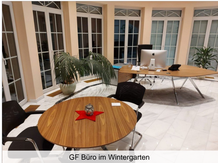
GF Büro im Wintergarten