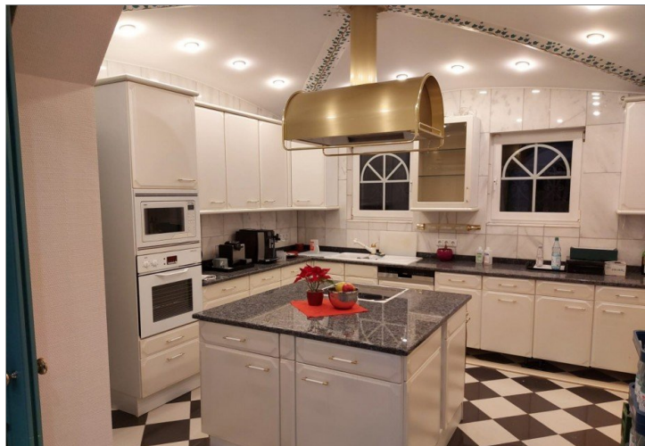
Küche / Mitarbeiterbereich