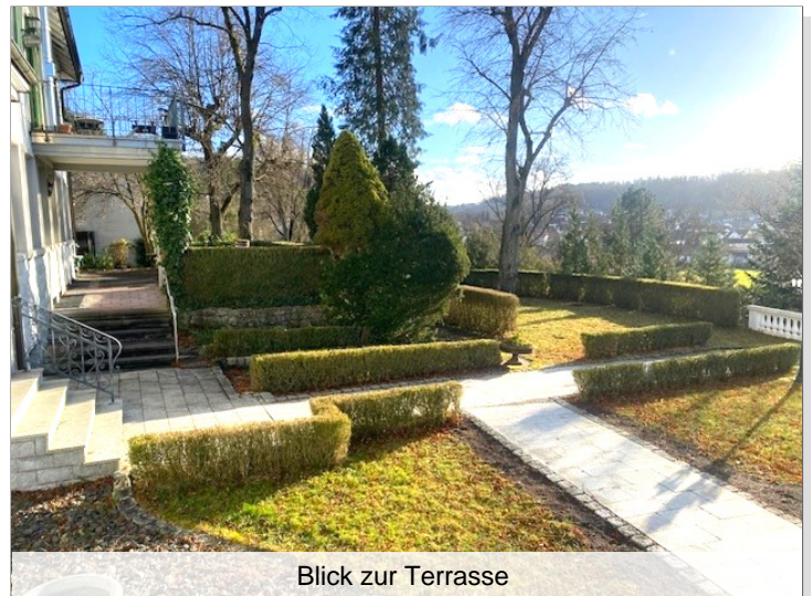
Blick zur Terrasse